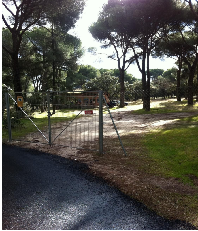
B.11.- Eliminación de 5 puertas privadas de chalets de la Urbanización Pinar del Plantío, que se han abierto con paso al recinto de Monte.